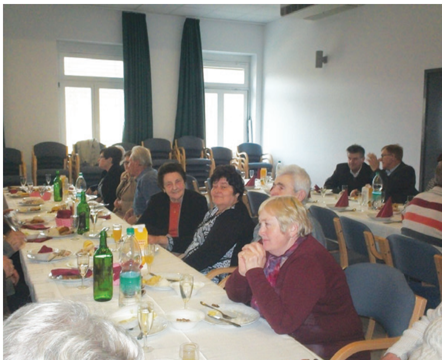
Občni zbor DU Žetale, 4.3.2017