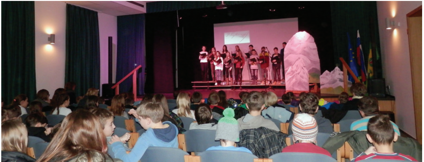
Utrinek s šolske proslave