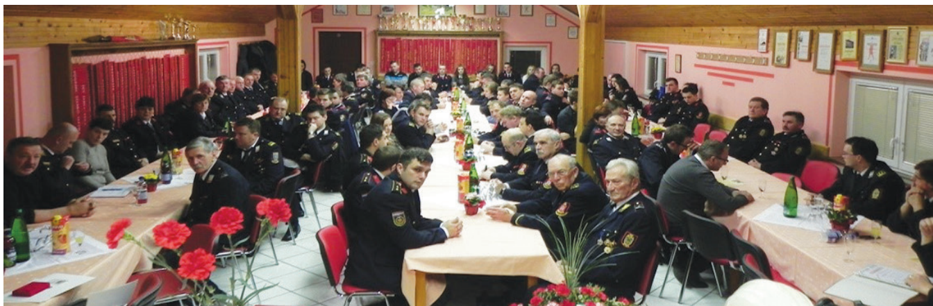
Občni zbor PGD Žetale, 11.2.2017 v Gasilskem domu Žetale