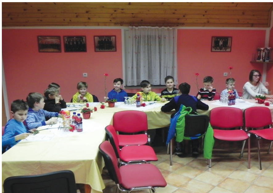
Mladi gasilci – naša bodočnost, Občni zbor PGD Žetale, 11.2.2017

Pobratenemu PGD Pekre se zahvaljujemo, da so nas predlagali za to visoko priznanje, GZ Maribor pa za podeljeno