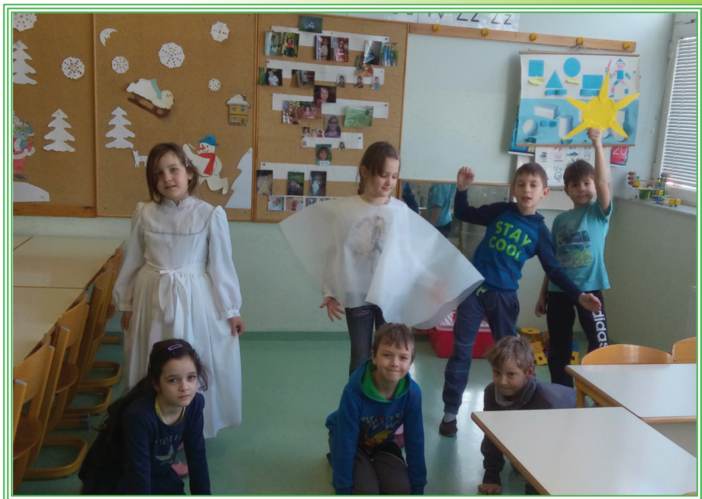
Tako drugošolci zaigramo Zvezdico Zaspanko